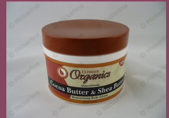
Ultimate Organics Cocoa butter & shea butter cream AB20261