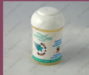
Crino Pomade coiffante Junior 125ml C12291