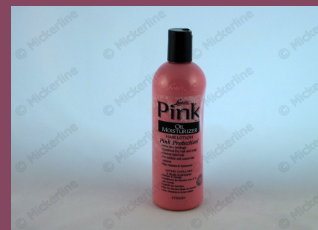
Pink oil Moisturizing Hair lotion C10362