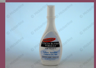
Palmer's Cocoabutter lotion 250ml C10477