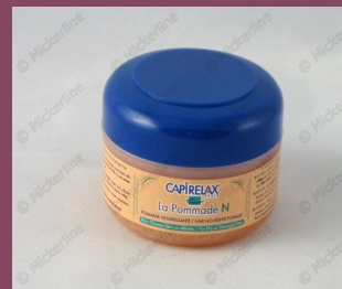
Capirelax la pomade N 100ml C13076